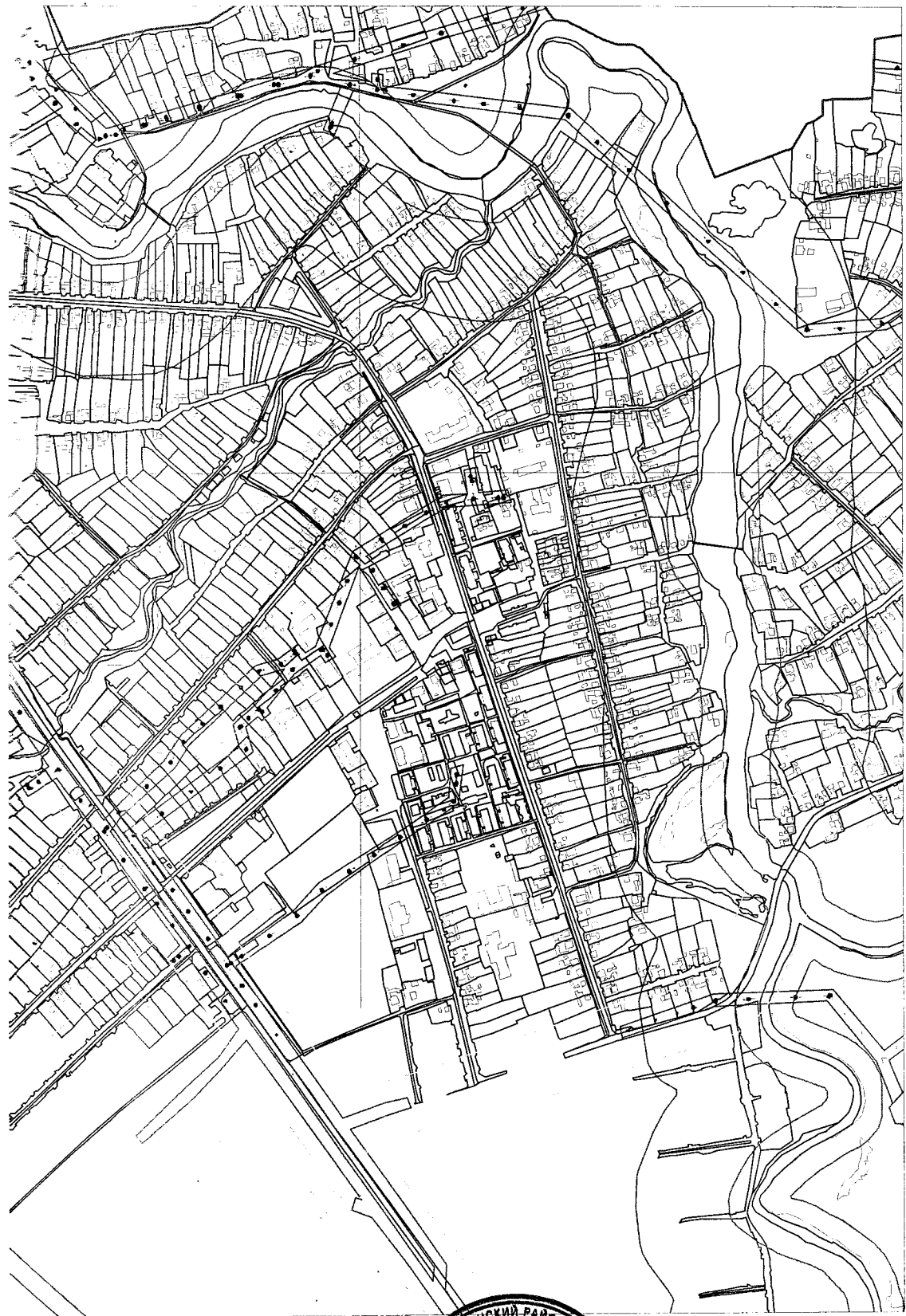
СХЕМА расположения магазина «Ариада»